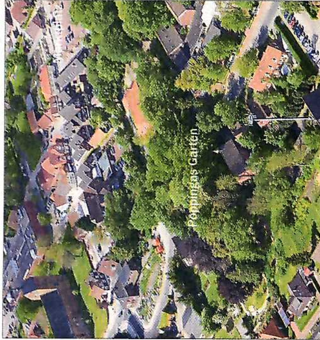
Früher eine grüne Oase mitten im Hager Ortskern: Der Tornado fegte die meisten Bäume weg. Auch ein 30 Meter hoher Ahorn fiel dem Sturm zum Opfer.